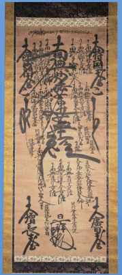
日祥本尊曼荼羅（北真経寺所蔵）

京都府では、文化財保護のすそ野をひろげるため、平成29年(2017)度から全国初の「暫定登録制度」が設けられ、登録が進んでいます。この企画展では、これまでに京都府暫定登録文化財となった向日市内の文化財のうち、扁額(社額)や古文書、鶏冠井檀林関係資料を展示して、さまざまな文化財が守り伝えられていることをご紹介します。